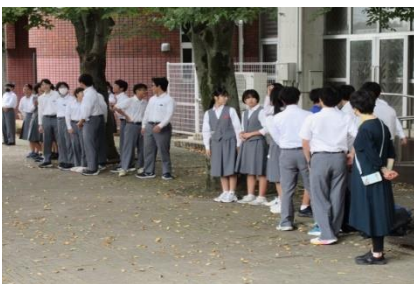
▲朝のあいさつ運動

9月末から10月初旬にかけて実施されたさいたま市新人体育大会では、生徒の一生懸命活動する姿が見られました。団体種目では卓球部と男子バレー部、個人種目では卓球部とソフトテニス部、陸上部、水泳でも県大会出場を決め、八王子中の生徒のパワーを感じました。また、10月22日に実施されたさいたま市駅伝大会でも早くから練習を重ね一生懸命取り組んできた努力を見せてもらいました。運動に限らず、学習や生活においても、生徒個々がさら