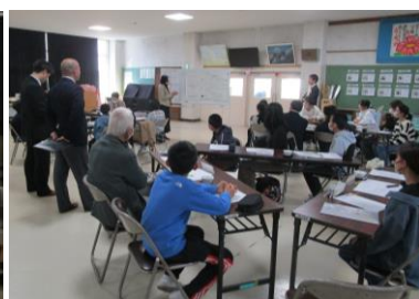
【熟議の様子 左:小学校 右:中学校】